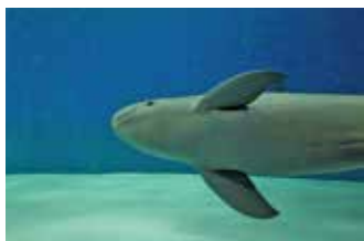
スナメリ

周防大島の久賀港から約6キロの離島「前島」。住民6人の小さな島へ行く前島航路ではスナメリがよく目撃さ