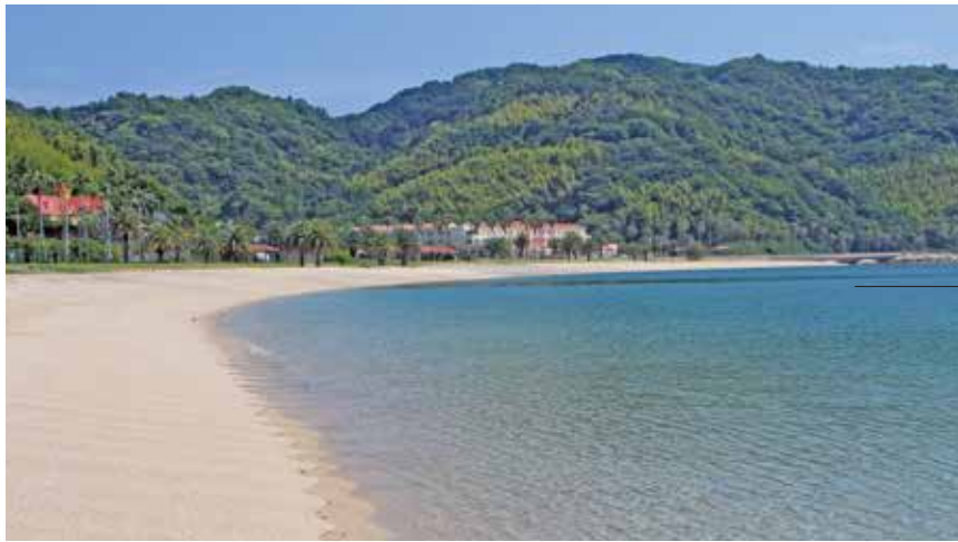
椰子の並木が美しい片添ヶ浜海水浴場

周防大島の海水浴場を代表する片添ヶ浜は、透明度の高い海と南国の雰囲気の特徴です。周辺にはリゾートホテル