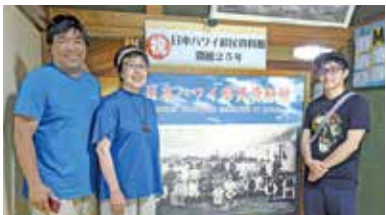
資料館で会った御一家

能。ほぼ毎日、移民として渡った子孫の3〜5世が同館を訪れ、自らのルーツを探しに来るそうです。記者が6月に訪れた際も、日系3世半だという男性とその家族が来館していました。データベースで分かった祖母の出身地を訪れると話されていました。