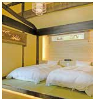
木の香りに癒される寝室

また同園は、創業20周年記念事業として棟の宿「おん宿 古今せとうち」を4月にオープン、この7月には2棟目も完成しました。同宿は、周防大島に柑橘栽培を伝えた「藤井彦右衛門」の屋敷を大正時代に解体する際、一部移築して建てられた古民家をリニューアルしたもの。歩いて海辺に行ける立地にあり、海水浴から帰ってそのまま入れる露天風呂も。キッチンがあり自炊もできます。