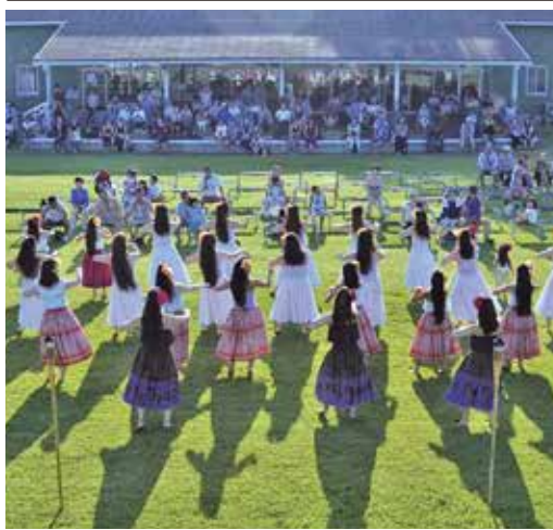
過去のサタフラの様子

「くか・夢夏まつり」が8月15日、周防大島町久賀防災センター広場(久賀庁舎周辺)で開催されます。花火や露店、人気地元歌手が登場のステージも。16日は