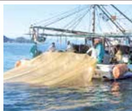
歴史あるイワシ漁

大竹市阿多田 大竹商工会議所は8月23日、「チャーターデイクルーズ in 阿多田島」を開催します。 イベントでは、まず1600年代から島に伝わるイワシ漁を見学し、島に上陸。イワシの加工工場などを見学した後、お弁当やイワシ料理