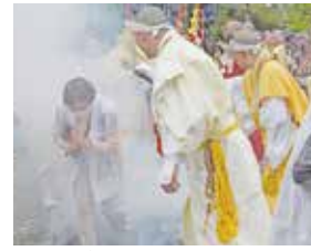
折りながら灰の上を歩く参加者

のこと。火渡り後は家で「ご利益を持って帰る」とを願い、足の裏についたススは流さないのが慣例。大聖院はこの火渡り式を年2回行っており、次の開催は11月15日です。