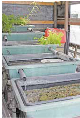
幼虫を育てる水槽