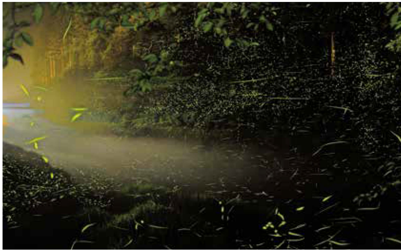
湯来で撮影されたホタル