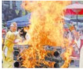
護摩木を火に入れる僧侶ら