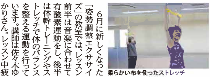
柔らかい布を使ったストレッチ

6月に新しくなった「姿勢調整エクササイズ」の教室では、レッスンの前半は音楽に合わせて有酸素運動をし、後半は体幹トレーニングやストレッチで体のバランスを整える運動を行っています。